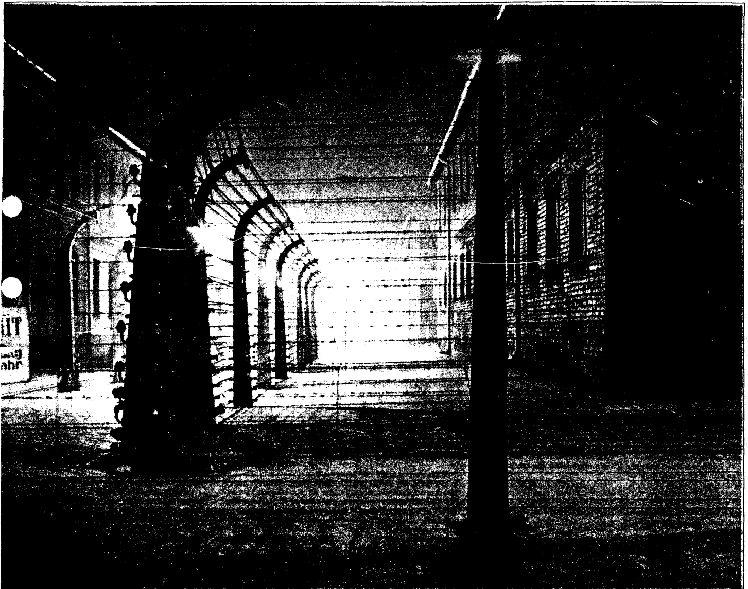
itt museum for å hjelpe oss å huske historien.

Den følger måten å forhindre et nytt Auschwitz på, er stadig å minne om det.