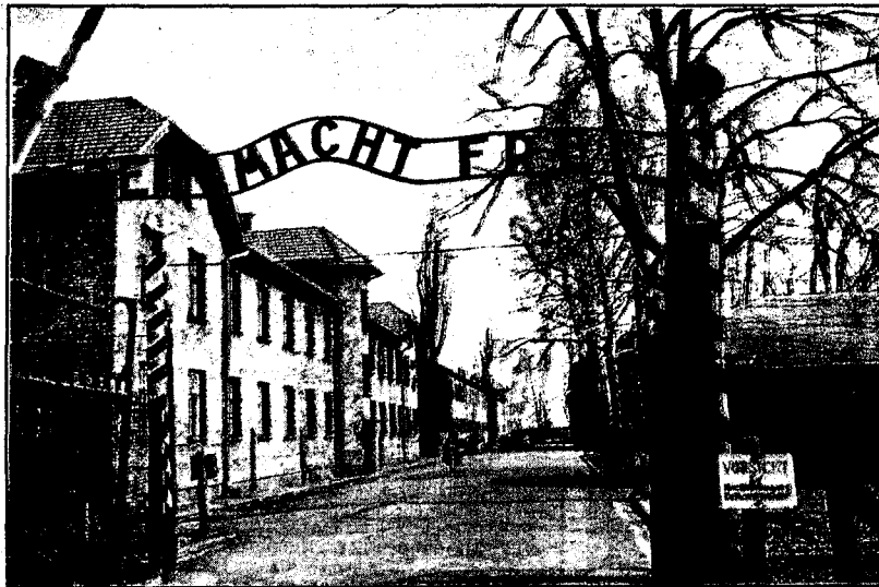
INNGANGEN: Inngangsportalen til Auschwitz I med dens grusomme løgn. Arbeid gjorde ingen fri.