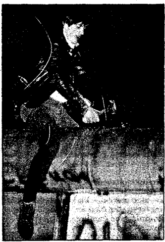
Den 9. november 1989 falt Bertinmuren for folkets hånd. Året etter ville mange gjøre datoen til ny tysk nasjonaldag. Hadde de glemt Krystallnatten?

til det beste i oss. Det er et voldsomt potensial i den norske befolkningen til fordel for liberale verdier.