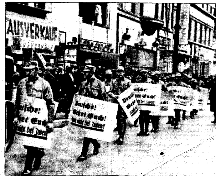
Natt til 9. november 1938, Krystallnatten. Jakten på jødene er begynt. Den endte i holocaust.