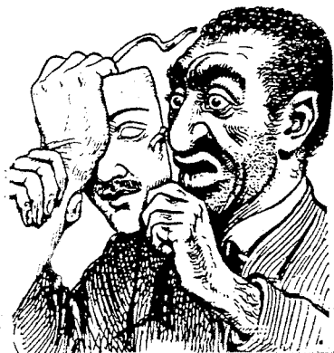
Tegning fra «Gjallarhorn»

Mens forbundet ellers konsentrerte seg mest om å arbeide for oppreisning og renavsing av sine medlemmer, var