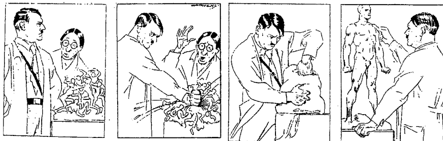
Adolf Hitler omformer det jødiske massemeneske til det ariske overmeneske. Fra Zorn88s tidskrift «Gjallarhorn».

Hvordan i all verden rettfærdiggjør det nazistenes systematiske forfølgelse av jødene gjennom 30-tallet som kulminerte i det mest ufattelige crescendo av menneskelig ondskap og bestialitet: Konsentrasjonsleirene og gasskamrene..?