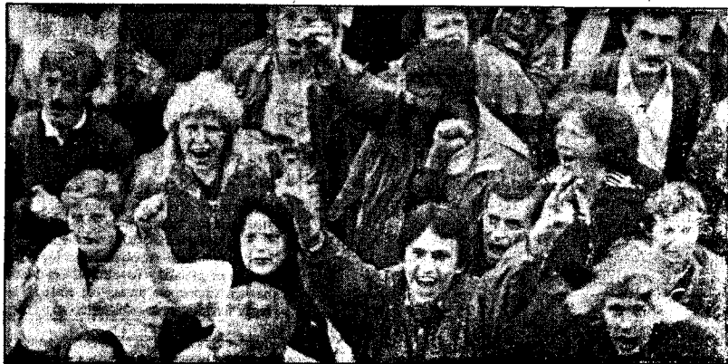
SEIER: Vi er i ferd med å bli et sivilisert land. Nå gjelder det å kvitte oss med restene av den 70-årige totalitære epoke. De første dagene etter at kuppet ble slått ned, gikk vi alle i en seiersrus.