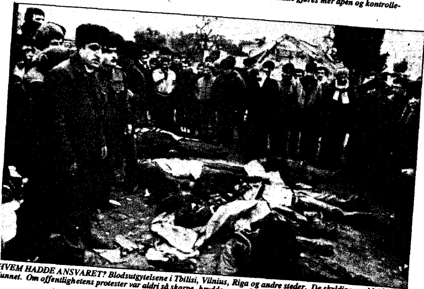
HVEM HADDE ANSVARET? Blodsutgytelsene i Tbilisi, Vilnius, Riga og andre steder. De skyldige er aldri blitt funnet. Om offentlighetens protester var aldri så skarpe, brydde generalene seg filla om dem.