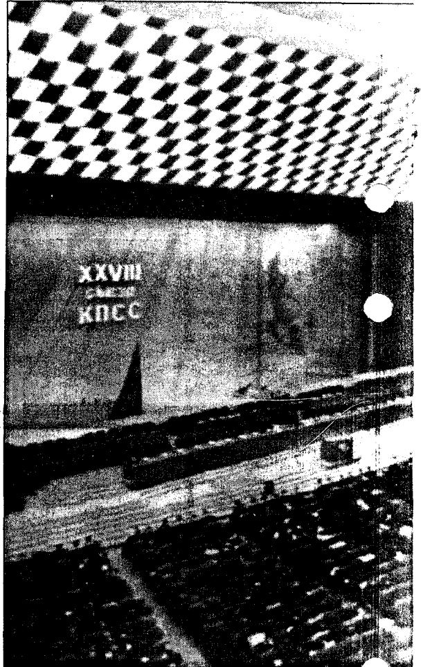
MAKTAPPARATET: Partiet hadde alltid rett. Det hadde makt uten ansvar, for den uten særlige begavelser eller profesjonelle kvalifikasjoner. De var i beste fall «livets manges vedkommende». De hadde mye å miste og kjempet innbitt for å bevare sine s

og de militære greide ikke lenger å tvinge frem sin vilje, men var i stand til å blokkere og sabotere viktige beslutninger, forhindre nødvendige reformer. Demokraterne var splittet, de sognet til ulike nydannede partier som ofte manglet samspill. Selve disse partiene var ikke sterke rent materielt.