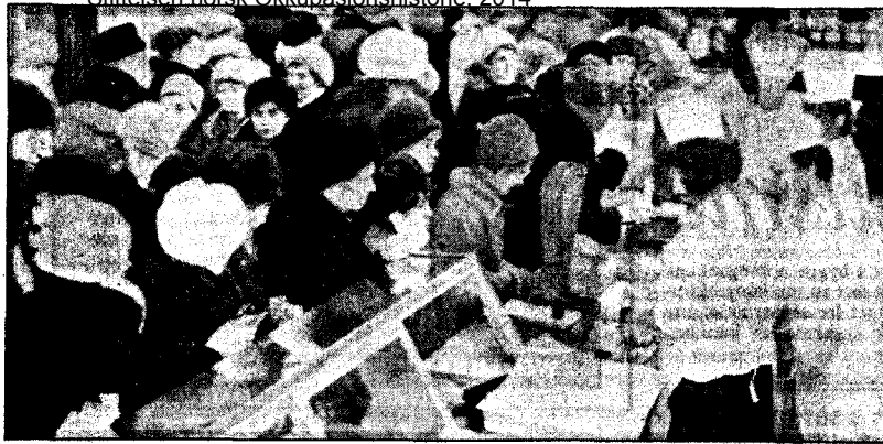
MATMANGEL: Varemangelen var himmelropende. De viktigste levnetsmidlene, f. eks. kjøtt, smør, sukker, gryn, hadde alt lenge vært rasjonert. For å få kjøpt disse rasjonerte matvarer måtte man svært ofte stå i tåmesvis fordi svikt i tilførselen var vanlig.