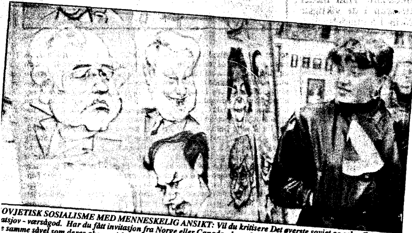
SOVIETISK SOSIALISME MED MENNESKELIG ANSIKT: Vil du kritisere Det øverste sovjet og selve Gorasjov - værsgod. Har du fått invitasjon fra Norge eller Canada - bare dra. Men maktstrukturene forblir nesten samme såvel som deres økonomiske grunnlag, den statsseide og -dirigerte industri og det kollektiviserte landbruk. Med andre ord var det fremdeles den sovjetiske sosialisme på sitt verste, men med menneskelig ansikt.

Dette er første del av to, andre del kommer imorgen.