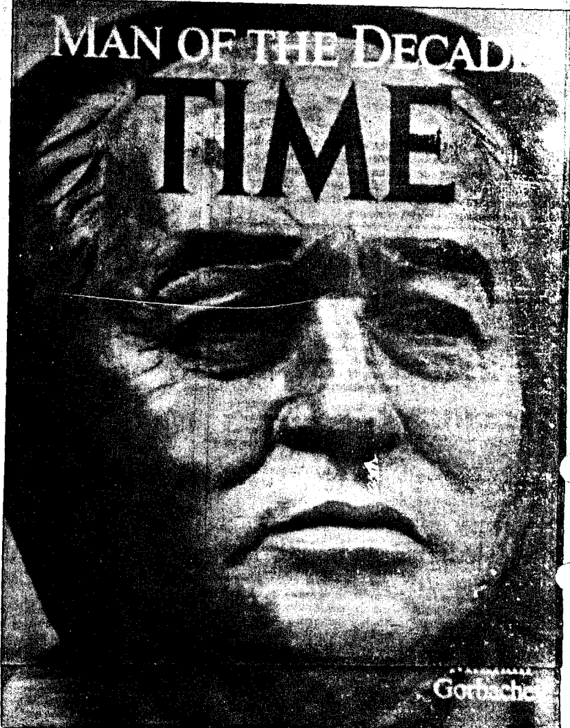
ARHUNDRETS POLITIKER? Det kan trygt sies at ingen av vårt århundres politikere har bidratt mer til en varig fred i verden enn Gorbatsjov og hans meningsfeller. Nobelfredsprisen hans er velforjent.

Som begivenhetenes gang har vist, var den første oppgaven den letteste. På noen få år har det politiske klimaet i hele Europa, ja i hele verden forandret seg fullstendig. Slutt på den skjendige krigen i Afghanistan, slutt på den kalde krigen, et fritt Øst-Europa, et forenet Tyskland, håndgriplige resultater i nedrustningen - alt dette ga verden god grunn til å trekke et lettel-sen sukk. Det kan trygt sies at ingen av vårt århundres politikere har bidratt mer til en varig fred i verden enn Gorbatsjov og hans meningsfeller. Nobelfredsprisen hans er velfor-tjent.