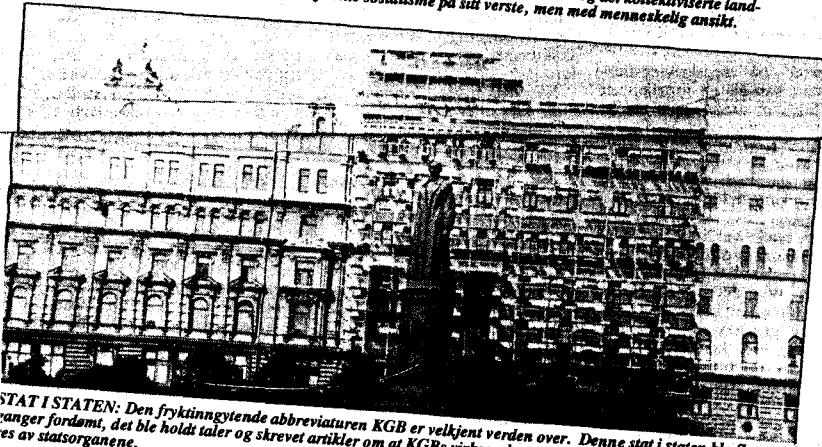
STAT I STATEN: Den fryktinngytende abbreviaturen KGB er velkjent verden over. Denne stat i staten ble flere ganger fordømt, det ble holdt taler og skrevet artikler om at KGBs virksomhet måtte gjøres mer åpen og kontrollert av statsorganene.