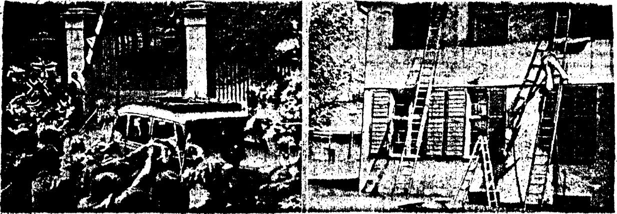
Skaugum renvasket. Til venstre: Kronprins Olav hilser Askar-barna etter å ha besøkt Skaugum i går ettermiddag. Til høyre: Skaugum har vært dekket med grønn kamouflasjering — men en god del var blitt vasket av, da kronprinsen besøkt sitt hjem i går.