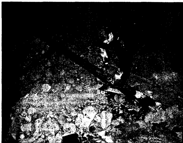
KU KLUX KLAN-KORS: Politiet sjekker det tre meter høye Ku Klux Klan-koret etter korbrenningen i Brumundal i oktober.