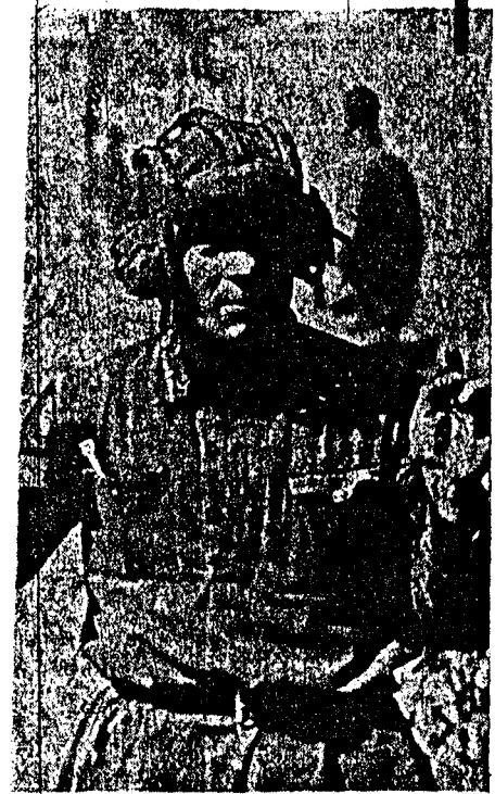
armvældets mekaniserte avdelinger er tipp topp modernstyrke er også voldsom, selv om det ennå ikke har vært noe avgjørende panserslag. Vårt bilde viser en sovjet-panservagn som er tatt til fange. Han ville ikke før han oppdaget at videre motstand var umulig.