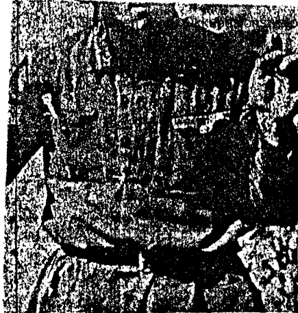
Umveldets mekaniserte avdelinger er tipp topp moder- styrke er også voldsom, selv om det ennå ikke har vært noe avgjørende panserslag. Vår, bilde viser en sovjet- panservagn som er tatt til fange. Han ville ikke for han oppdaget at videre motstand var umulig.