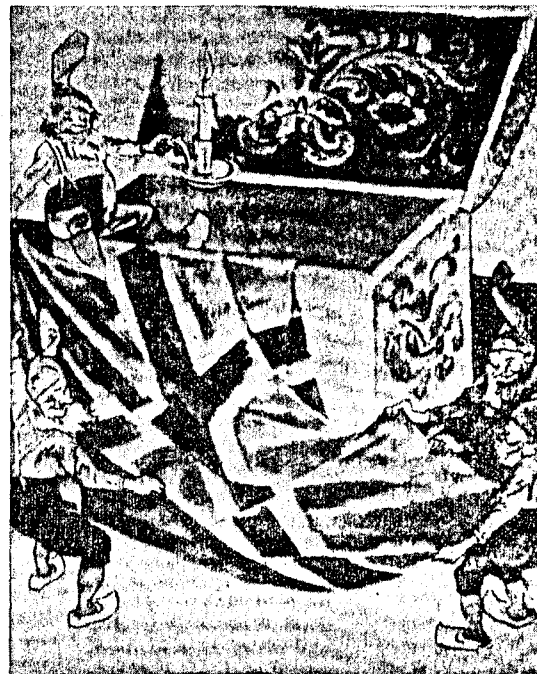
Patriotisme på mørkeloftet.

I. En emu, hva er det for noe? Det er en australsk strudseart, som er blitt kjent over hele verden p.g.a. sin taktikk å stikke hodet ned i ørkensanden, når den tror seg utsatt for fare eller ubehageligheter. Dermed tror den den hellige grav vel forvaret. Emuen er ikke som sin strålende afrikanske fetter utstyrt med overdådige fjær på vinger og hale. Den ser tvertimot fattigslig ut, hvilket kanskje er forklaringen på, at den flakser med ving-