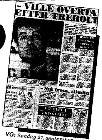
VG: Søndag 27. september.