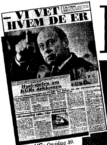
VG: Onsdag 30. september.