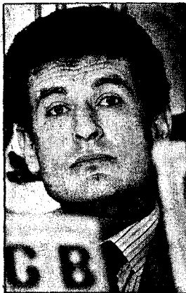
AVHOPPER: I Mikhail Butkovs bok skriver KGB-avhopperen om KGB's norske «fortrolige forbindelse» med dekknavnet «Dudin».