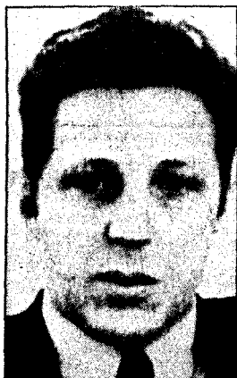
KGB-SJEF: Leonid Makarov, tidligere KGB-sjef, hadde kontakt med Einar Førde.