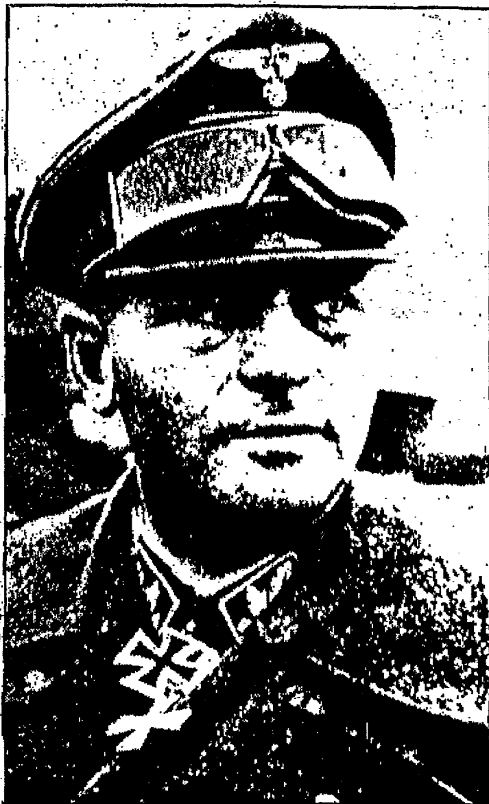
Hitlers favoritt SS-general Steiner i egen ekte person.