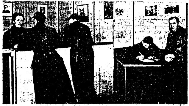
Fra Frontkjemperkontorets ekspedisjon.

ikke rekke om vi aldri så gjerne vilde. Vi så gjerne at gavene strømmet enda rikligere inn, selv om det ikke er små summer vi får både fra private og kommunene. — Har De noe spesielt ønske i øyeblikket? — Det måtte være at frontkjemperne viste overbærenhet i tilfelle de ved enkelte anledninger får nei. Vi kan ikke rekke alt, og dessuten har vi våre bestemte regler og direktiver å gå etter.