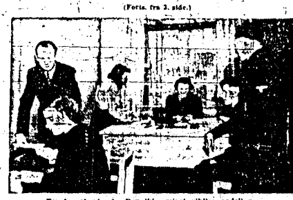
Fra kassakontoret. Den ikke minst viktige avdelingen.