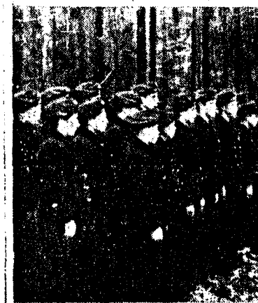
Noen av de uniformerte avdelinger. Til venstre Unghirdmarinen.

Med ff-Treuelied var den høytidelige stund forbi.