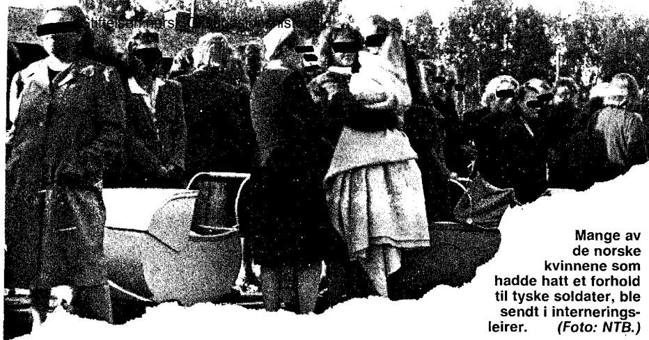
Mange av de norske kvinnene som hadde hatt et forhold til tyske soldater, ble sendt i interneringsleirer.