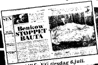
FAKSIMILE: VG tirsdag 6. juli.

Ambassadør Kaarlo Yrjö-Koskinen driver diplomatisk linedans i det ytterst delikate spørsmålet om frontkjempersteinen: