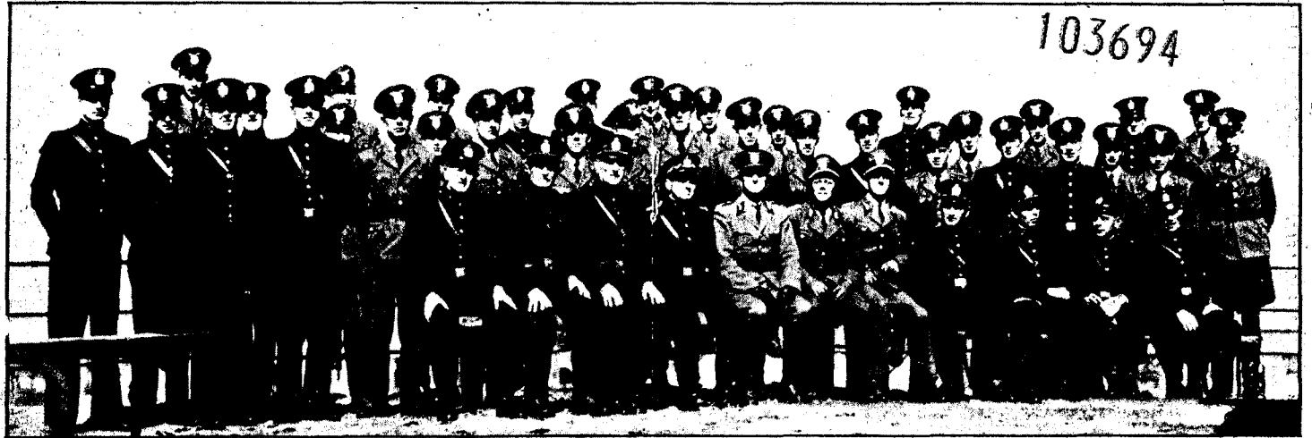
Erfarne og nyansatte politifolk, i gamle og nye uniformer, ved Alesund politikammer, fotografert 1. mai 1942.

Forlagt og trykt: Chr. Schibsted, Oslo - - C