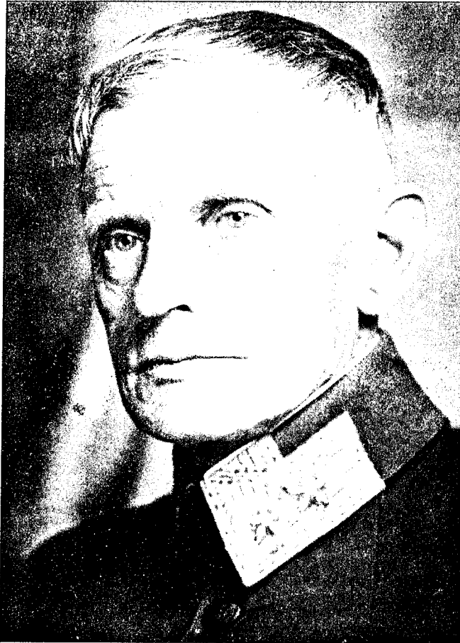
General Otto Ruge var blant de mange nordmenn som betraktet de russiske krigsfangene som «et diplomatisk problem».