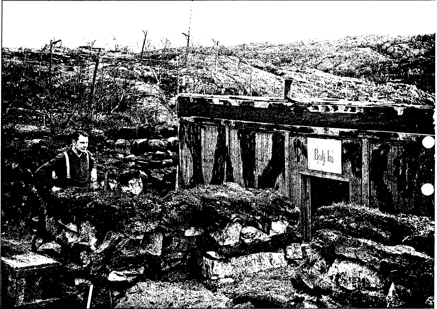
En russisk fangeleir i Norge. Hjemme ventet en enda verre skjebne de russiske krigsfangene.