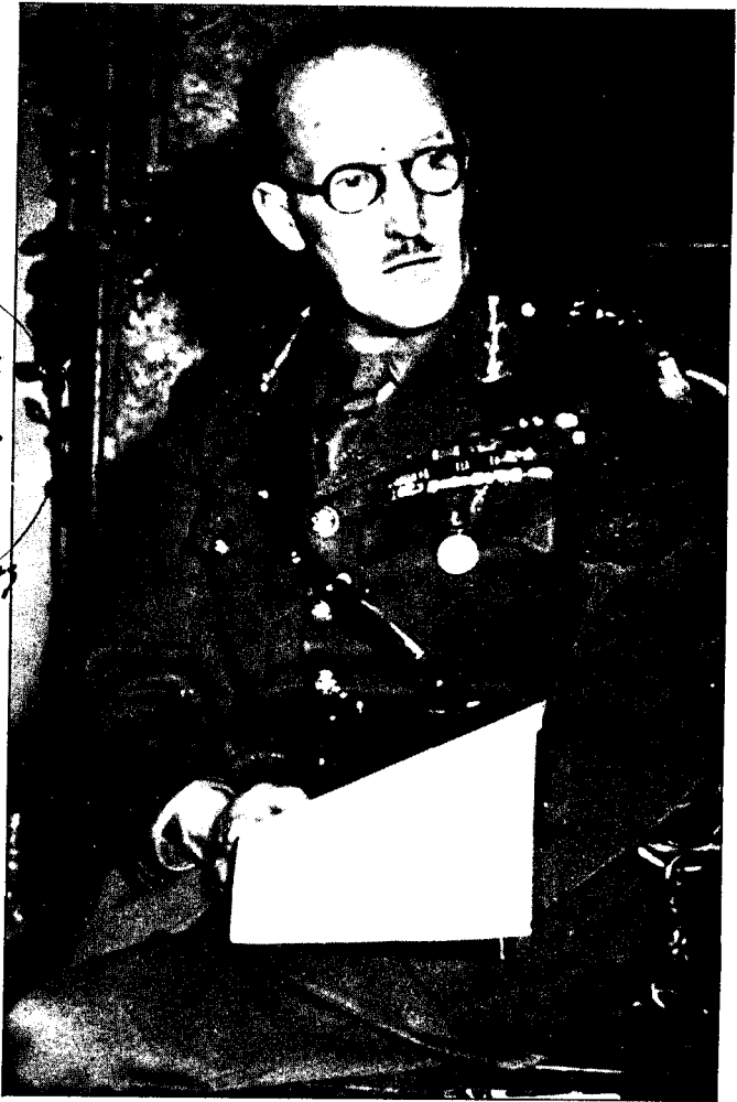
General Andrew Thorne var øverstkommanderende for de allierte styrkene i Norge i 1945.