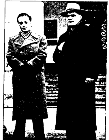
General Ratov hadde 167 mann i tjeneste i Norge, mange av dem SMERSH-agenter.