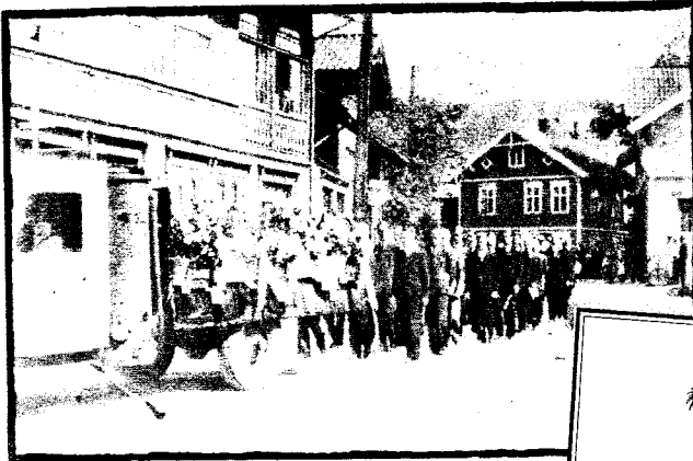
STILLE: Det var et stille følge som gikk gjennom Skotfoss ved fellesbegravelsen den 30. juli i 1943.