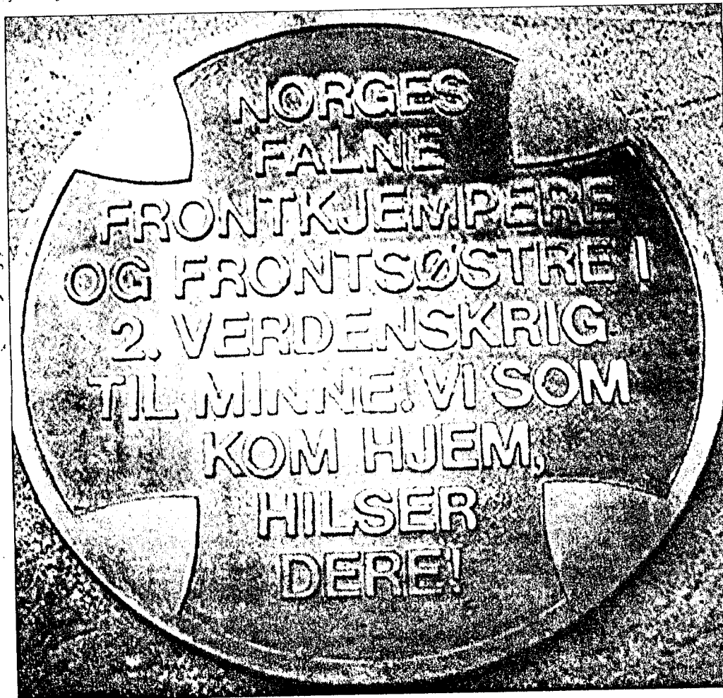
ØDELAGT: Plaketten som hedrer norske SS-soldater måler rundt 60 cm. i diameter, veier 15-20 kilo og er i massiv bronse. Den er nå ødelagt.

– Gammel-nazistene forsøker gjerne å dekke seg bak at tida har gått. «Det er på tide å slutte å hate.» Jo, det er på tide å slutte å hate. Derfor fjernet vi frontkjempernes minnesmerke i Bamble, på stedet som til nå har vært samlingspunkt for hatets fremste apostler – gamle og nye nazister. Og dette gjør vi i solidaritet med dem som falt i kamp mot fascistene, ofrene for deres terror og de som overlevde dette helvetet, sier talsfolk for gruppa som slo til mot minne-varden i Bamble.