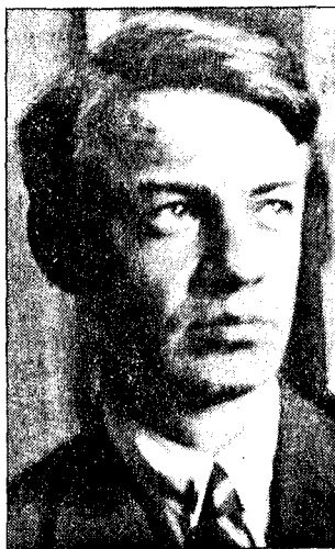
HELT: Viggo Hansteen var den reelle LO-lederen frem til han ble skutt 10. november 1941.