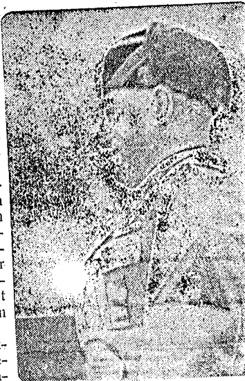
MUSSOLINI har lämnat NF på sitt öde.

I och för sig har ju Italiens utträde ur NF inte allt för stor betydelse, det ändrar ju intet på något bestående styrkeförhållande. Men genom det skedda har NF:s karaktär av stormaktsallians blivit påtagligare och åtskilliga både statsmän och andra i de stater, som borde vara neutrala, ha fått upp ögonen för det riskabla i varje bebländelse med Genèveintention. Till dessa stater hör Schweiz, där man inom förbundsrådet diskuterar en nyorientering av utrikespolitiken i överensstämmelse med landets hävdvunna neutralitet och starka krafter verka för ett utträde inte bara de facto utan även de jure ur NF. Den nationella oppositionen, vars styrka visade sig i omröstningens om frimurarnas vara eller icke vara, har kraft en folkomröstning även om Genèvefrågan och det väntas, att dess utgång kommer att bli ett klart misstroendevotum mot NF. I varje fall ser man hur de ansvariga i detta lilla land med förbundsrådet Motta i spetsen börjar få upp ögonen för NF-politikens faror.