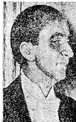
Dr. Guido Schmidt, Østerrikes utenriksminister.

De forhandlinger som skal etterfølge den mulige underskrift på overenskomsten som sikrer Østerrike mot å bli erobret, dreier sig i første rekke, betones det, om de uløste økonomiske spørsmål som