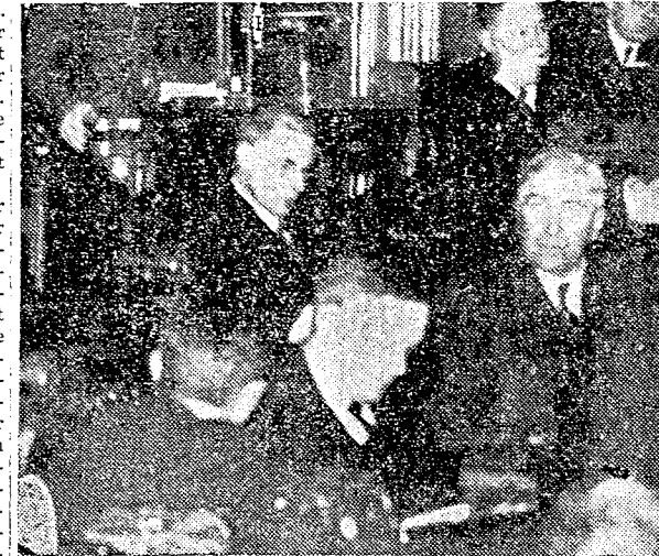
Arbeiderpartiets parlamentariske fører Støstad taler i Stortinget igår.