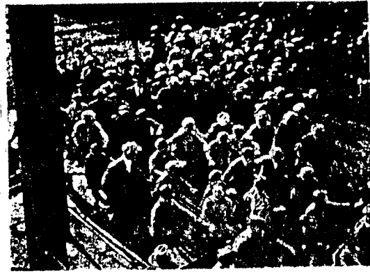
Demonstrantene forlater lasteplassen, speiserande over de nedtråkkede grønsene.

for å oppta kampen med en flokk på ca. 1000 mann, og lot dem passere. De skyndte seg imidlertid foran og ned til inngangen til fabrikkens 1000 mann, og lot dem passere. De skyndte seg imidlertid foran og ned til inngangen til fabrikkens 1000 mann, og lot dem passere.