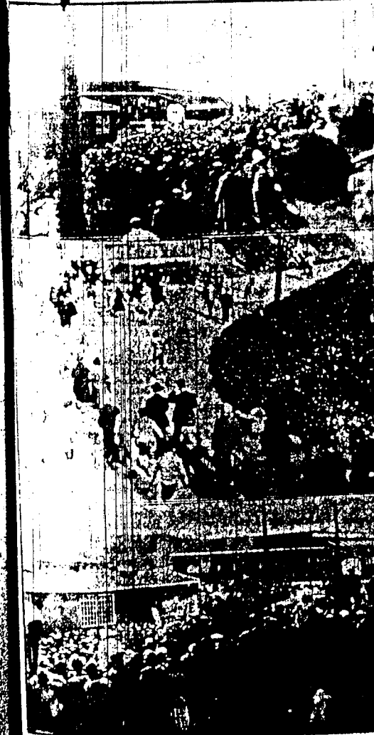
Overfor demonstrantene foran porten til lasteplassen. I midten. En av de arbeidspliktige ledere er fra arbeidsplassen av en politibetjent. Nederst. Gjerdet er sprengt og demonstrasjonen stormer inn på plassen.

for hvem lørdagen og igår har vært travle dager.