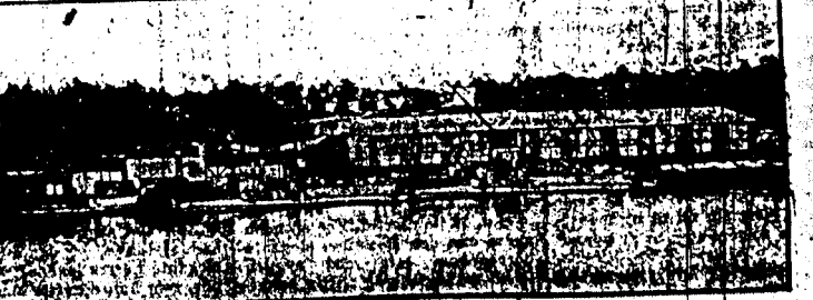
Minutleggerne og torpedobåtene ved legerhuset på Menstad. Tilvenstre skimtes skrogene av den fyrte båt som låsten.