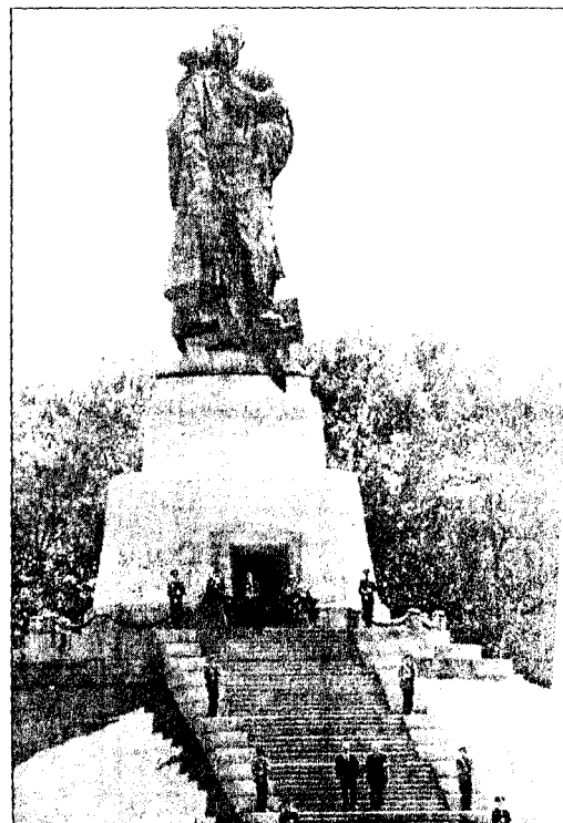
KOLOSS: President Jeltsin og forbundskansler Kohl (hånd i hånd) små foran krigsmonumentet i Treptow.

-320 000 av våre soldater døde på tysk jord. Livet ble