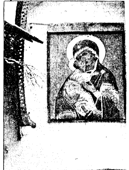
IKONOSTAS: Den russisk-ortodokse kirke titalls millioner dollar.

Ikke alle ønsker å gi sine skatter til et slikt museum, om ikke av andre grunner, så fordi det er umulig å garantere at folk får adgang og at bildene blir sikret. En filmregissør i St. Petersburg – han ønsker ikke å bli navngitt – har en storartet samling av russiske og europeiske malerier,