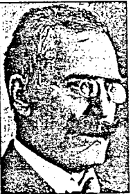
NOBELPRISVINNEREN, Bjørn Knud Hamsun. I et universitet oppkalt etter seg?