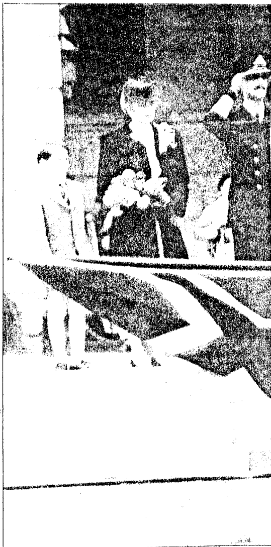
PARADEN: 15 000 fra Hjemmefronten paraderte foran Slottet de

General Montgomery ville frigjøre Norge sydfra i april 1945, men Eisenhower nølte. Jens Chr. Hauge avdekker «en annerledes tysker».