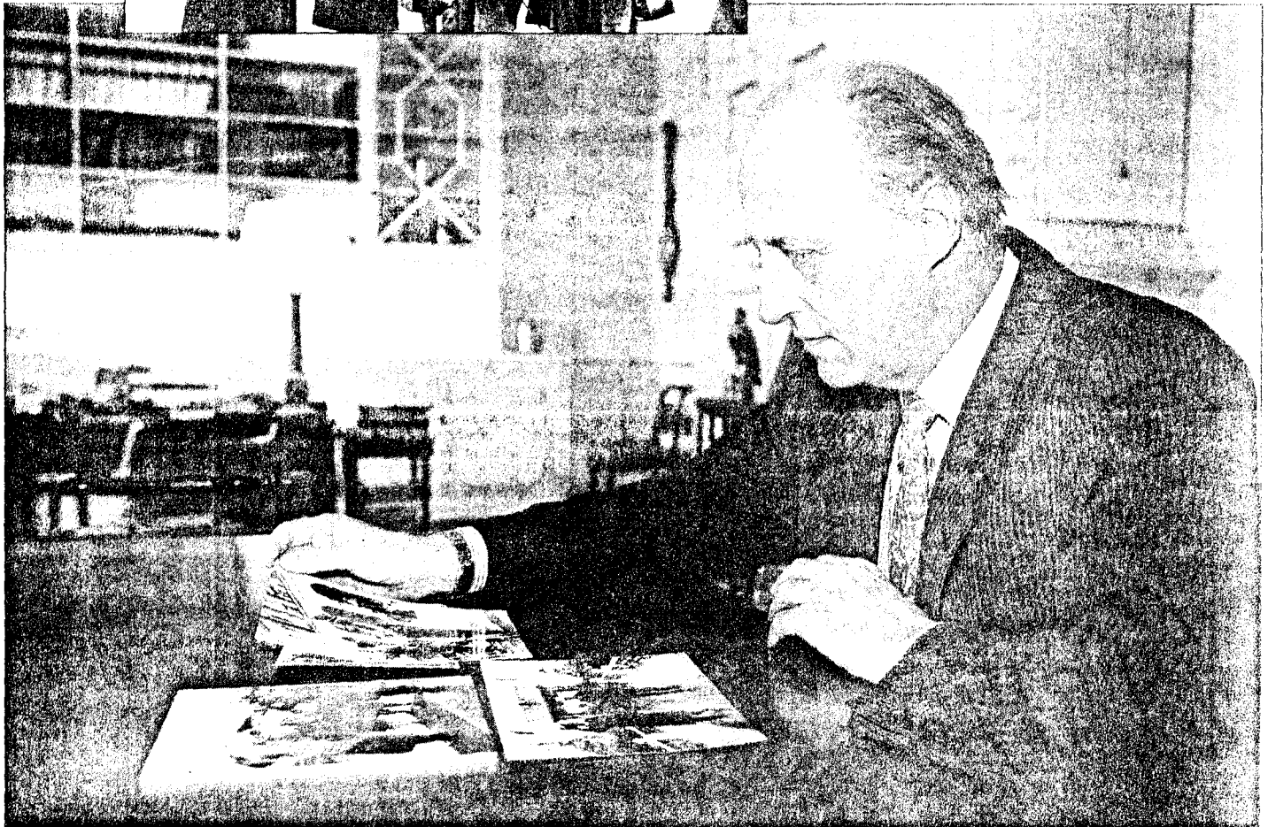
BRACKETI, HJEMKOMST: Kong Harald studerer bilene av seg selv tatt ved hjemkomsten til Norge 7. juni 1945. Han innrømmer at han ikke husker stort fra selve dagen, bare at det var veldig mye bråk.