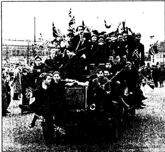
JUBELBRUS: Norge vant såvisst ingen krig. Vi var ikke i krig. Vi var ikke engang alliert med seierherrene. Med unntak av en tredjedels promille av befolkningen - hadde ingen opplevd krig.