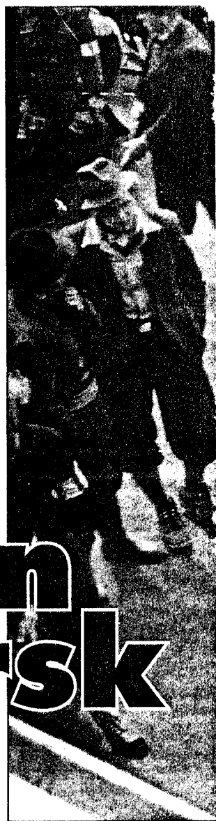
HEVNENS TIME: Mange som selv NS-medlemmer arrestert på Ski.

gene 1945 tenkte vel over teksten i denne sang som plutselig var vår felleseie, egentlig er dypt villedende. Norge vant såvisst ingen krig. Vi var ikke i krig. Vi var ikke engang alliert med seierherrene. Bortsett fra uteseilerne, frontkjemperne og en ganske liten kontingent av London-soldater - en tredjels promille av befolkningen eller så - hadde ingen nordmenn opplevd «krig» i den egentlige mening av ordet: ikke vært mobilisert, ikke stått under kommando, ikke vært tvunget til å gi opp sine sivile goder under trussel fra krigsrettens barske lov. Okkupert var nok landet, tungt og trykkende besatt av fremmede tropper. Men heller ikke som okkupert ble vi tilnærmedesvis så utplyndret, fornødret eller trakkassert som vanlig var og er, når fremmed krigsmakt med full rustning tar opphold i et land. De fem tusen dristige, motstandsbevegelsens heltemodige ungdommer som fra bunnen av byene og i ly av dalene valgte en frivillig geriljastand mot denne overmakt, levde selvfølgelig i egenforskyldt livsfare. Men mor