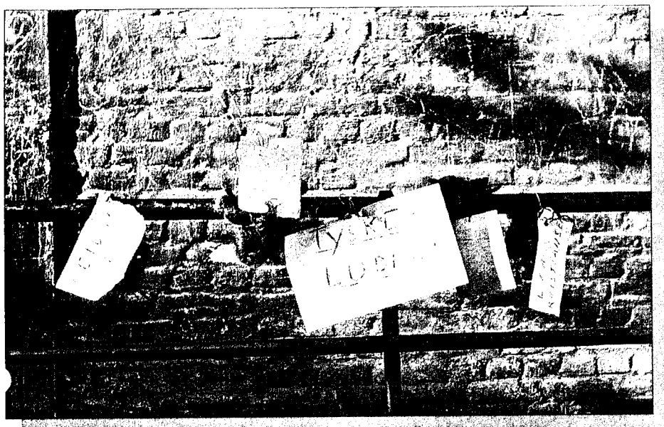
“Tyskertøsenes” hår ble klippet av og hengt opp med navneskilt.