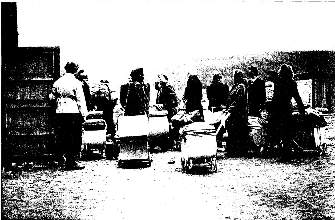
Norske og tyske jenter ved avreise til Tyskland i 1946.

Interneringen av «tyskertøsene» med hjemmel i den provisoriske anordning mot kjønnsykdommer ble av mange sett på som en del av de overgrep som ble gjort mot