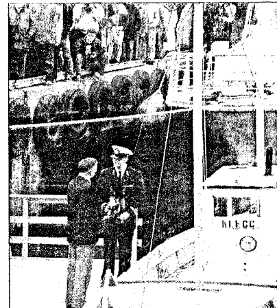
BERØMT: En av mange berømte overfarter under krigen sto denne 22 fot store «Klegg»-fer. Den gikk fra Ålesund med sju mennesker om bord. Alle kom utrolig nok fram. På kaien i Ålesund mandag fortalte Ivar Refsnes kronprins Haakon om den strabasjose turen.