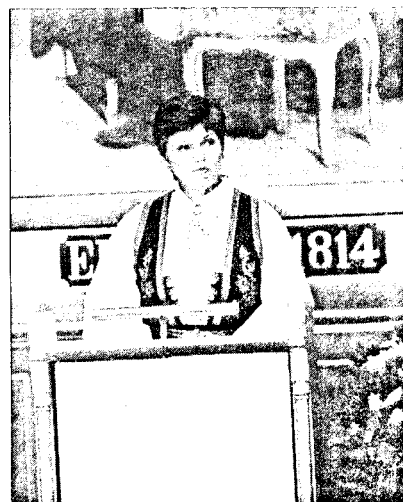
TILGI: Tilgi, men ikke glemme, sa stortingspresident Kirsti Kolle Grøndahl i minnetalen i Stortinget mandag.