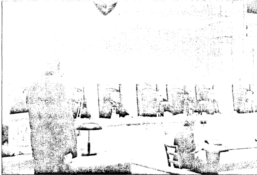
SKYLDIG: Lagmannsrettsaken mot Vidkun Quisling begynte mandag 20. august 1945 og ble tatt opp til doms 7. september. Tre dager senere falt dommen: Quisling ble kjent skyldig i nesten alle tiltaleposter og dømt til døden. Dommen ble anket til Høyesterett som stadfestet lagmannsrettens kjennelse, og Quisling ble henrettet natt til 24. oktober.

Da prosessen mot Quisling ble åpnet i Logens store sal, der representanter for både norsk og internasjonalt presse og kringkasting var møtt fram i stort antall, kunne aktoraten — i tillegg til den lange tiltalebeslutningen — legge fram sensasjonelle opplysninger om at Quisling hadde stått i ledtog med tyskerne før 9. april 1940. Hemmelige tyske dokumenter som de allierte hadde beslaglagt i Tyskland, kunne fortelle at Quisling i møter med Hitler, storadmiral Raeder og sjefen for det tyske nazi-partiets utenrikspolitiske kontor, raseideologen Alfred Rosenberg, i desember 1939 hadde drøftet en tysk aksjon mot Norge, angivelig for å