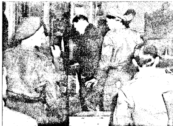
FØRES UT: Vidkun Quisling føres ut av Logens store sal etter å ha mottatt dødsdommen den 10. september 1945.

Hitler stolte ikke på sine norske forbundsfellers diskresjon. Men Quisling grep sjansen og proklamerte — i tillit til Hitlers støtte — om kvelden den 9. april sin «nasjonale regjering» med seg selv som