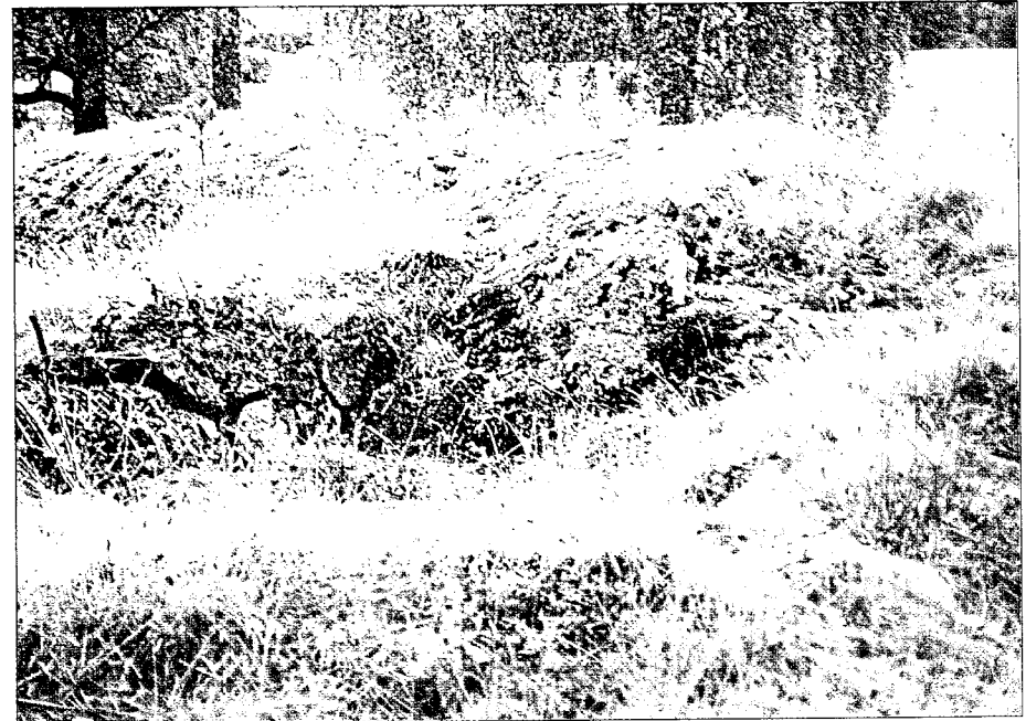
Det glir fint inn i terrenget det tyske brystvernet av sten fra 1944.

Det var en slitsom tid med tyskere over alt på gården. Vi måtte passe oss for ikke å provosere, men stillferdig lukke grunder og reparere nedrevne gjerder. Det var jo ekstra fortærende å se et par befal smyge seg gjennom tunet i tussmørket en kveld med en kjempestor råbukk de hadde krypskutt nede i kålåkeren på Raskerud. Det ble nok festmiddag for tyskerne dagen etter. Men en dag glemmer jeg aldri, da tyskerne gikk manngard i skogene her i Eidsberg. Det var en fin høstdag, og vi hadde skåret havren langs veien vest for skolen. Om ettermiddagen