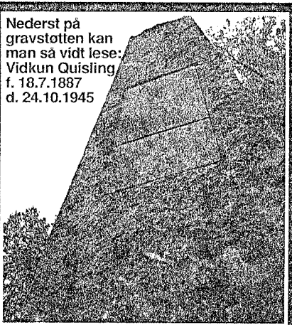
Nederst på gravstøtten kan man så vidt lese: Vidkun Quisling f. 13.7.1887 d. 24.10.1945