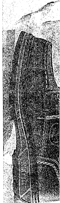
Råtøff sko med flotte detaljer

Avslappet, praktisk og rustikke mottakelse hos SKORINGEN