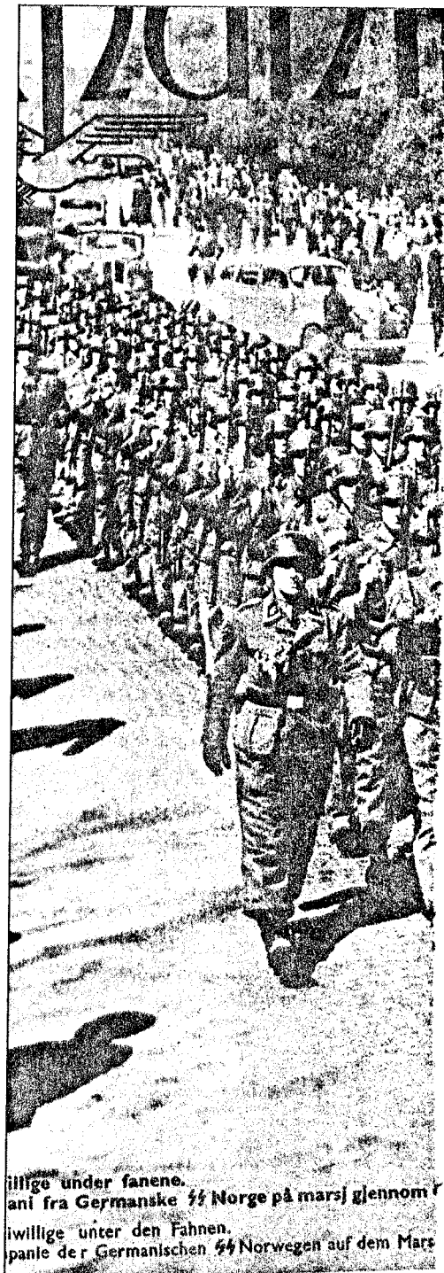
Uvillige under fanene. Barna til frontkjemperne måtte bote for foreldrenes handlinger. Mange av dem ble fratatt livforsikringen som deres fedre tegnet før de døde i krigen. Blant barna er det mange som har hatt psykiske problemer, og forholdsvis flere enn foreldrene, som i nesten ett hundre prosent av tilfellene mener at det de gjorde var rett.

Blant barna er det mange som har hatt psykiske problemer, og forholdsvis flere enn foreldrene, som i nesten ett hundre prosent av tilfellene mener at det de gjorde var rett.