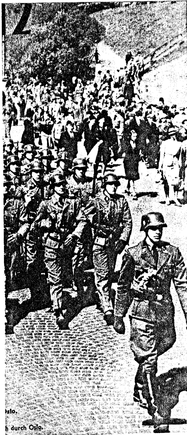
i spissen marsjerer ned Slottsbakken 17. mai 1943.