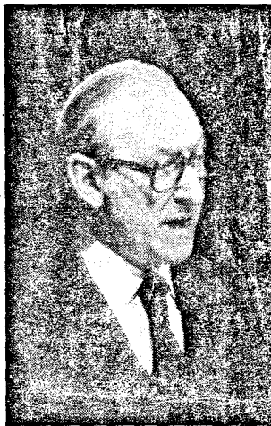
Kurt Waldheim. «Det er ydmykende å vite at jeg gjennom ti år arbeidet iherdig for en mann som løy bevisst om sin fortid og at jeg til og med forsvarte ham offentlig».