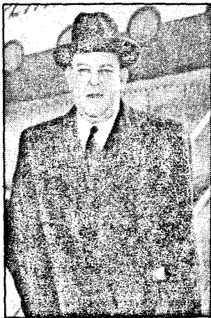
Trygve Lie, «en enkel mann som baserte seg mer på bondefulhet og det han kalte sin politiske nese enn på intellektuelle anstrengelser og diplomatisk arbeid.»

Sir Brian Urquhart – generalsekretærenes høyre hånd: