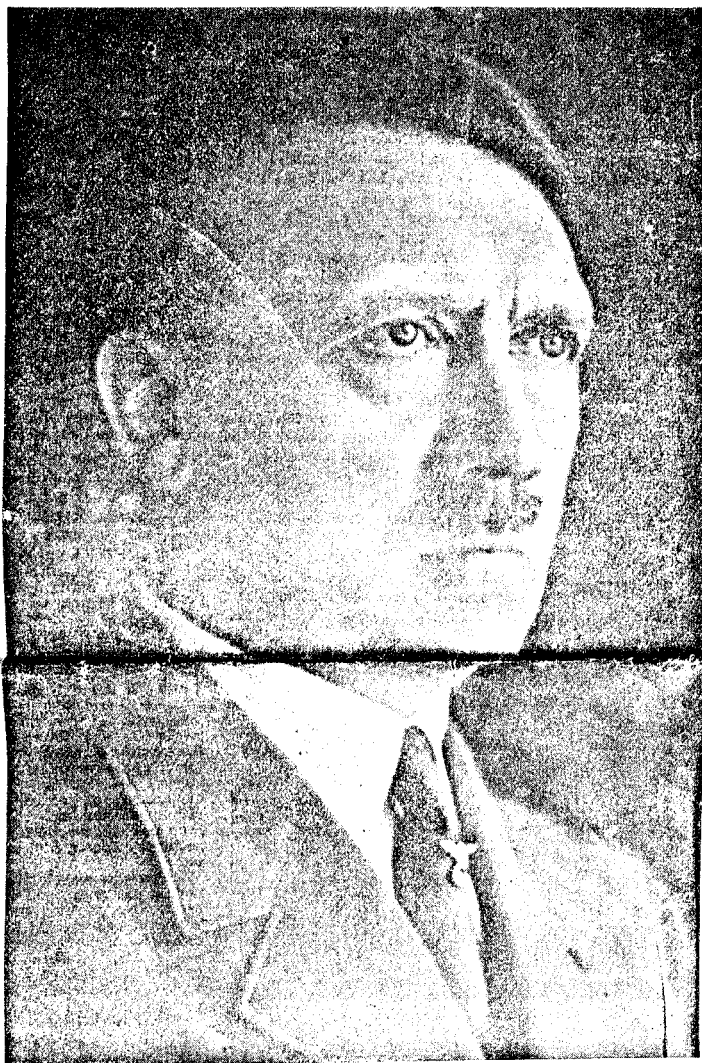
Fra der Führers hovedkvarter meldtes tirsdag kveld kl. 22.27 at vår Führer, Adolf Hitler, var falt for Tyskland på sin kommandoplass i Rikskanselliet, kjempende mot bolsjevismen til siste åndedrag