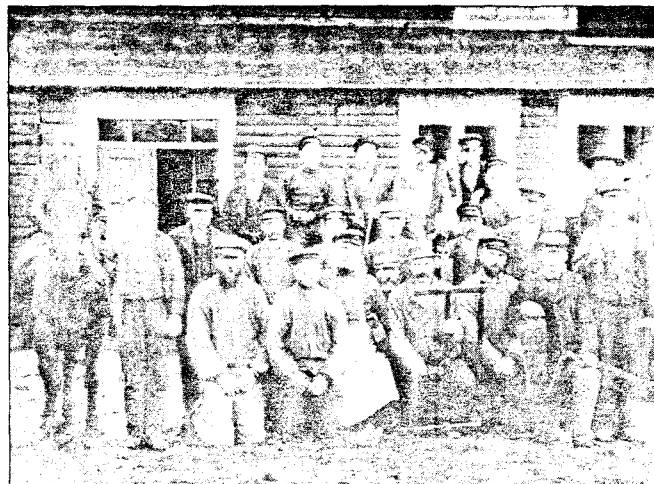
STOLT FOLK: Til tross for forfølgelser, ydmykkelser og overgrep holdt taterne sammen så lenge det lot seg gjøre. Ekteskapet (over) hadde høyt status, og selv i arbeidskolonien Svanviken (nede t.v.) utviste de en stolt holdning. Familier reiste sammen, også når de ikke hadde de råd til hest (t.h.).

Mest grusom ved siden av tvangsplasseringen av barn på barnehjem er bruken av steriliseringslov i 1934. Forfatterne dokumenterer en rekke til-