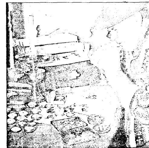
EKSPERT: En reisende urmaker i arbeid. Taterne laget deler til klokkene og graverte dem, og var et fast innslag på markedsdager og dyrskuer.