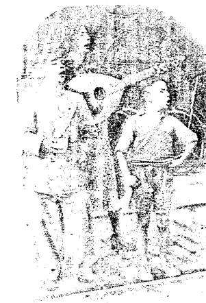
SANG: Taterne utmerket seg med stor musikalitet. Her noen reisende musikanter som tjener til livets opphold.