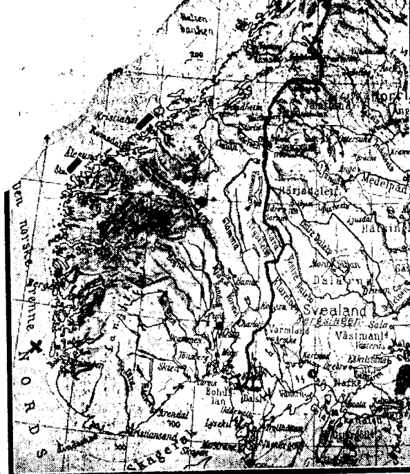
De sorte strekene på kartet antyder hvor minefeltene er. Det stedet utenfor Ulstra, hvor vi hadde minefelt under forrige krig er merket med X. De nåværende minefeltene ligger som en ser utenfor Stalt, Bud ved Hustadvika (mellom Molde og Kristiansund) og sør i Vestfjorden.

sempel i brutal maktanvendelse. Mineutleggingen vil ikke legge hindringer i veien for norske skip som skal gå inn til norske havner.