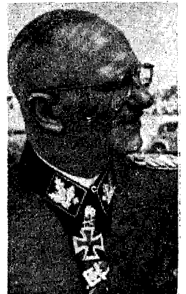
Wikings annen divisjonssjef, den høyt dekorerte «kjelespesialist» SS-Obergruppenführer Herbert Gille, også blankt frifunnet i Nürnberg.

Hvem er det som står bak alt dette, og hva er det en vil oppnå eller skal dekke over?