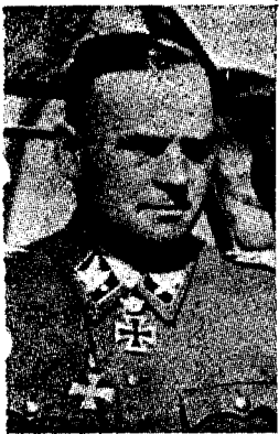
Divisjon Wikings første sjef SS-Obergruppenführer Felix Steiner, blankt frifunnet i Nürnberg.