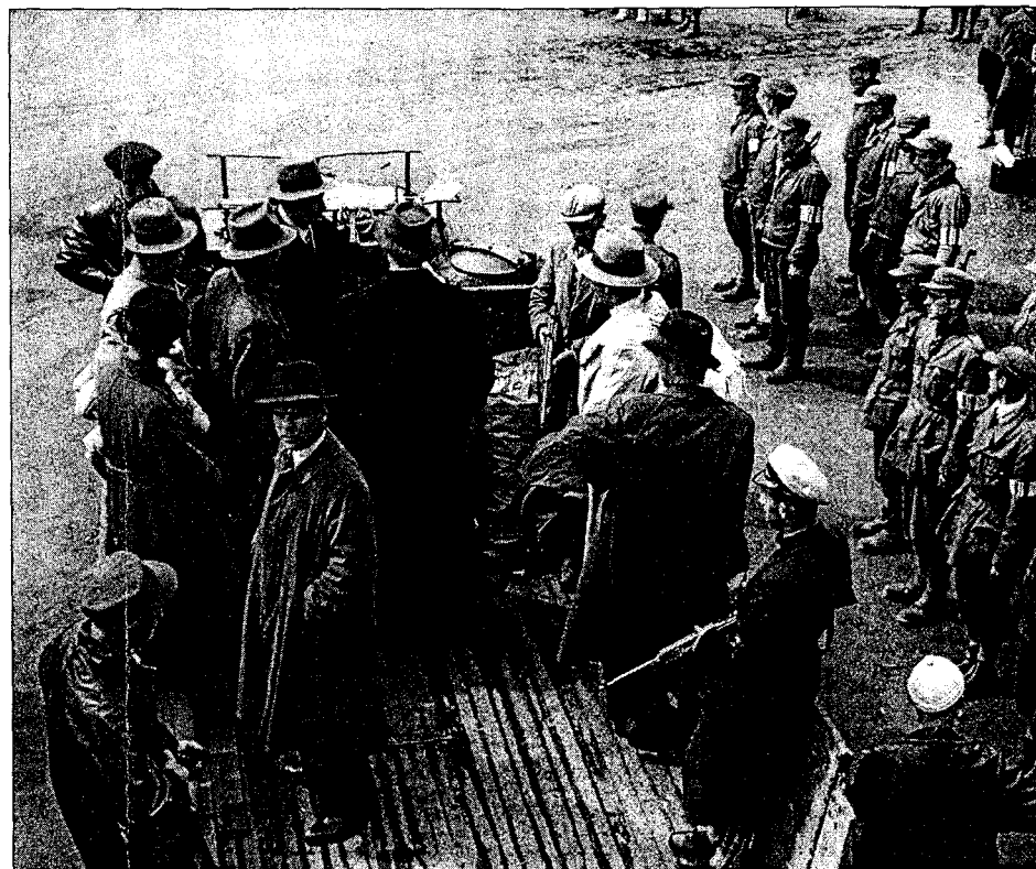
DÅRLIG BEHANDLING. Mange landssvikdømte ble dårlig behandlet mens de satt i fangenskap etter 8. mai 1945. I en ny rapport hevdes det at flere ble mishandlet og at 29 døde av behandlingen de fikk. På bildet blir NS-medlemmer arrestert på Ski i Akershus i 1945.

Forholdene i NS-leirene var kontroversielle. Det store flertallet mente at landssvikerne fikk som fortjent. Myndighetene likte dårlig at det ble stilt spørsmål ved saken. De som tok opp de dårlige forholdene for NS-fangene, ble stem-