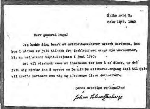
Brevet fra dr. Scharffenberg til general Ruge høsten 1952.