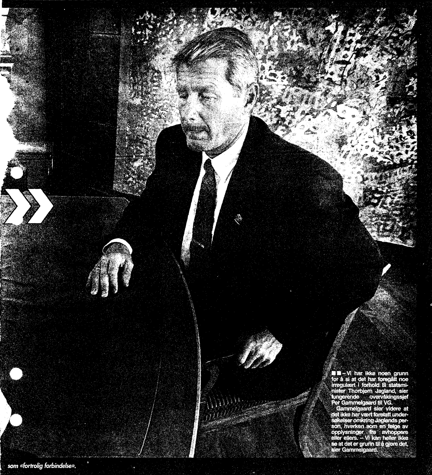
som «fortrolig forbindelse».