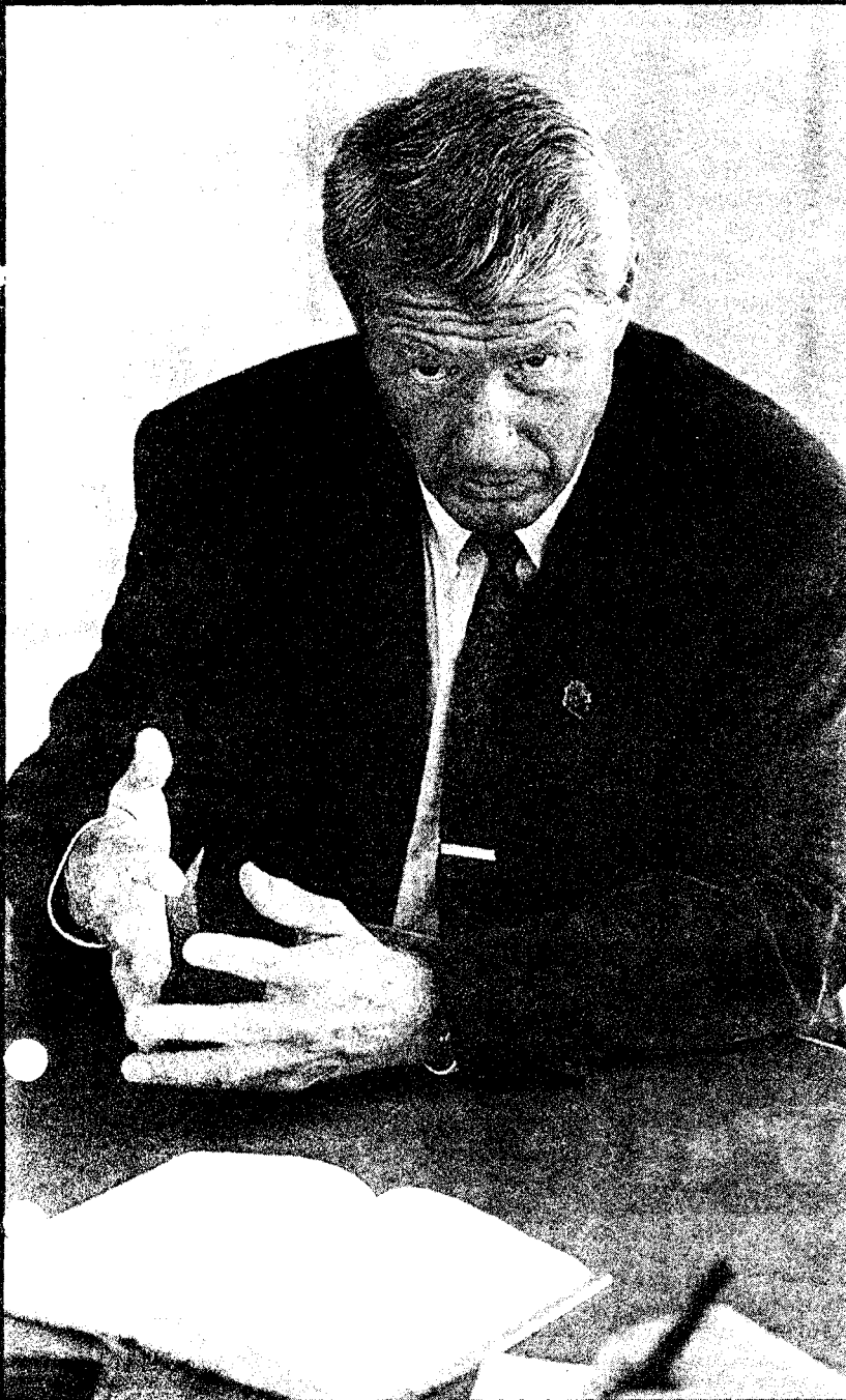
den politiske situasjonen i Norge slik at Sovjetunionen ikke skulle misforstå situa-