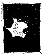
•PARTI FRA SKOLEGÅRDEN. Tåsen skole i 1950-årene.