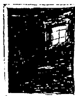
•KJELLERVINDUET. Stedet for klastrofobitviktning