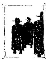
•DE TAUSE MENN.

Og de gjorde ikke noe galt mot h a m. Bortsett fra å ikke innromme. Bortsett fra å ikke ta et oppgjør med antisemittismen. Selv Holocaust fornekta de da alle andre var i mer eller mindre sjakk.