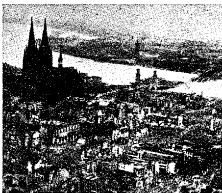
Her er et Billede fra den ødelagte Rhin-by Kahn. Rundt om den velbevarede Kathedralkirke ligger sønlige Bygninger i Ruiner, og i Floden ligger Resterne af det sprængte Hohenzollern-Bro.