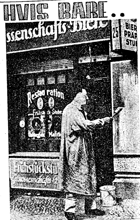
HAVDE DET BARE VÆRET SAA VIL, skriver et engelsk Blad om dette Trick-Gillede af den halvgale Maler fra Pilsen. For Menneskeheden vilde det efter alt at denne Hare været det Bedste, om han var blevet ved sin Palet.

Der kommer nok igen gode Tider. Leve vort ulykkelige Land. Leve Ungarn.