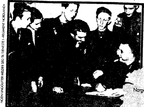
5000 meldte seg til fronttjenesten

– betegnelse for nordmenn som vervet seg til tysk krigstjeneste under 2. verdenskrig. Felittogene norske frontkjempere deltok i et tegnet inn.