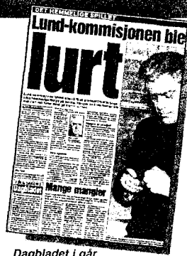
Dagbladet i går