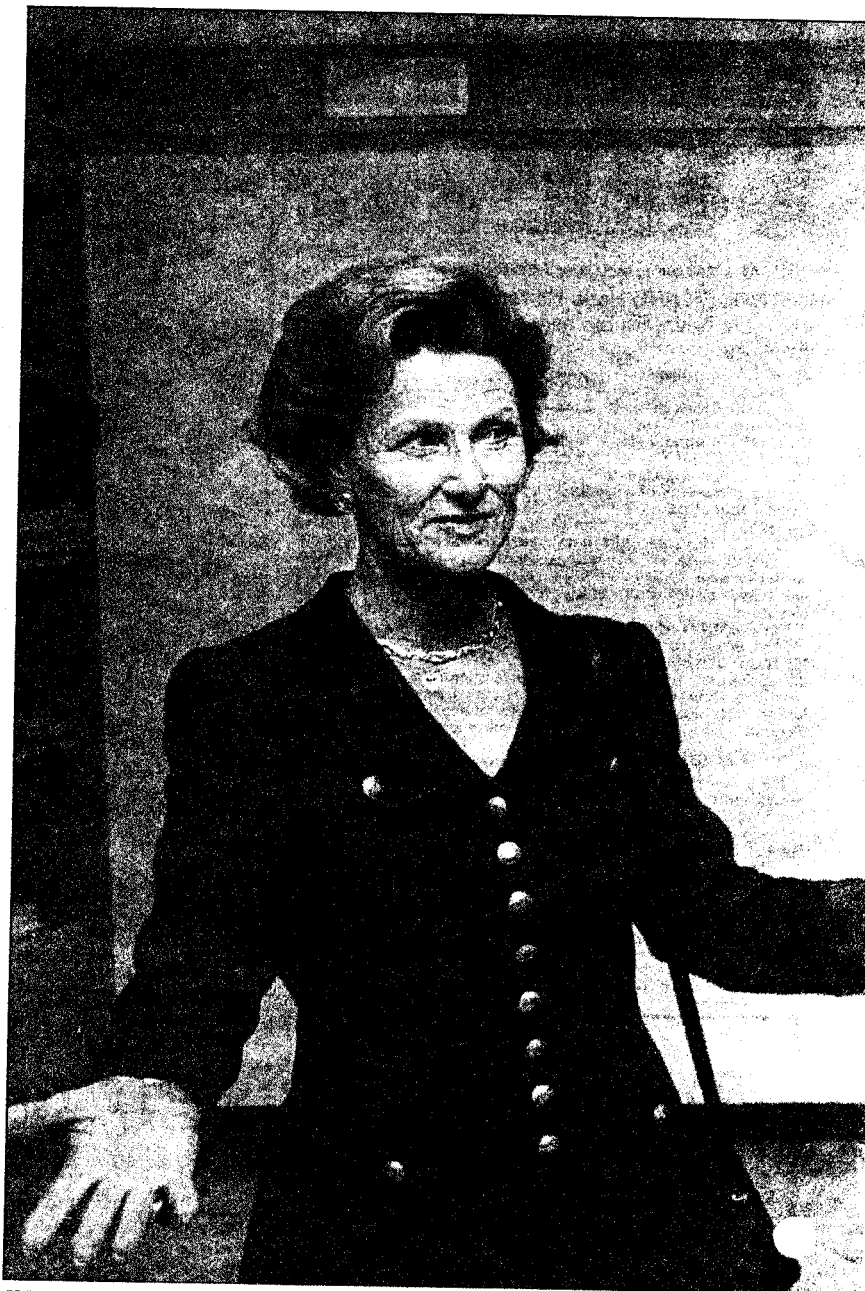
HAR PENGER I UTLANDET: I tilfelle en krisesituasjon har kong Harald sammen med dronning Sonja en betydelig formue i utlandet som kongen arvet etter sin far.