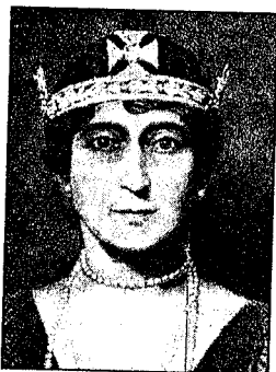
ARVET: En engelsk kongeeksperter mener at dronning Maud skal ha arvet til sammen en milliard kroner i dagens pengeverdi etter sin far.