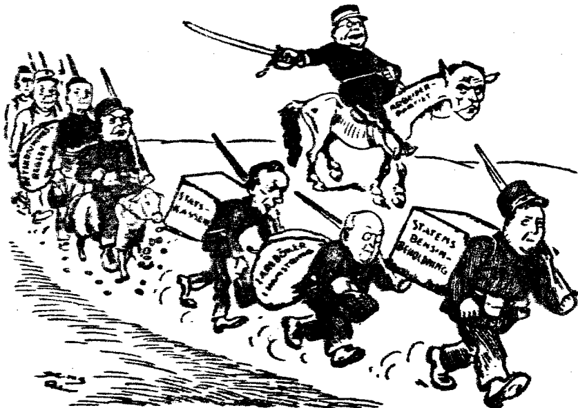
Statenshavnen forlener seg at vi er godt rustet til en slagvåk krig.