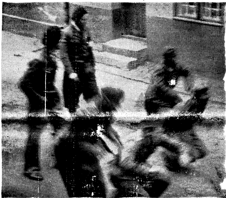
To hjemmefronthelter driver straffeekseris med 4 frontkjempere

Frontkjemper i 5 døgn uten mat i eneselle på Ilebu